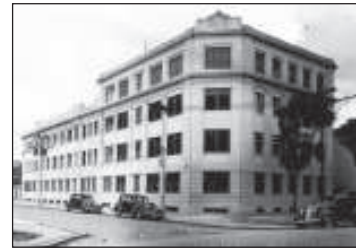
O majestoso prédio foi inaugurado em 1934

Convite à Comunidade Em modernas instalações, o complexo hospitalar, tem capacidade para realizar 1000 cirurgias ao mês, 400 partos, além de ter 200 leitos disponíveis ao dia. Outra novidade é a medicina solidária. "Após uma visita ao assistente social, o paciente paga um preço acessível, de 10 a 40 reais, inclusive quem não tem convênio ou SUS (Sistema Único de Saúde)". Brunini destacou também a importância de se ter a mobilização da comunidade do Brás e redondezas (Mooca, Belém, Pari, Cambuci) para fazer uso do Hospital,