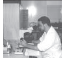
Com laboratório próprio, o Hospital dinamiza todos os seus serviços

com que ele poderá levantar recursos e trazer mais público.