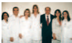
Aqui um cliê especial, com o médico Alckmin e equipe do Hospital CEMA

Em seguida, deu notícias animadoras, sobre a diminuição da mortalidade infantil, que em 1940 era de 143 por mil crianças nascidas e hoje é de 23, e o aumento da expectativa média de vida, que em 1940 era de 43 anos de idade, e atualmente está em 74 anos. "Tenho duas outras boas notícias. Os estudos mostram que em 2050, vamos passar de 100 anos de idade. E a segunda, é que as mulheres não morrerão mais", brincou, arrancando risos do público presente.