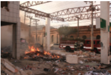
Ayr da Ponte Pequena apresentou vários problemas do bairro