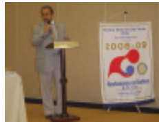
Fio tomará posse como presidente do Rotary Brás, gestão 2009/2010 dia 1º de junho próximo