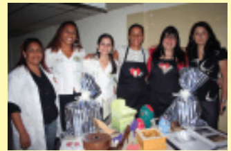
Alegres e atenciosas, as funcionárias primam pela qualidade dos produtos

Com sede no Jardim São João, Tremembé, zona norte da cidade, o Caspiidade rea-