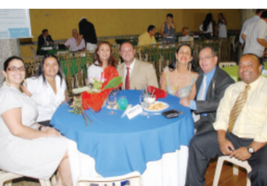
Adepom, sempre ao nosso lado