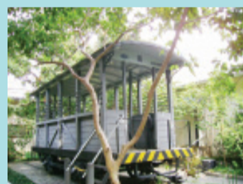
O Bonde de areia tinha a função de espalhar areia nos trilhos para evitar derrapagens dos veículos que carregavam os passageiros

O local também guarda relíquias, desde o primeiro bonde a circular no Brasil - no Rio de Janeiro, em 1859, e em São Paulo, em 1872 - até o primeiro trólebus de fabricação nacional, produzido em 1960, ou o importado, de 1948 até uma interessante galeria de fotos e cartazes publicitários, documentos e instrumentos, entre eles autenticadora de cheques, projetor e maquetes da antiga CMTC, além de uma biblioteca aberta ao público para consulta.